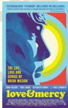
17-20 julio LOVE & MERCY (NR -12)