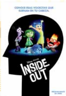
24-28 julio DEL REVÉS (TP)