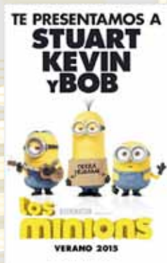
10-14 julio LOS MINIONS (TP)