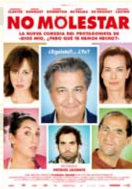
11-14 julio NO MOLESTAR (NR -7)