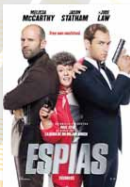
20-21 julio ESPIAS (NR -16)