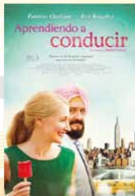
25-28 julio APRENDIENDO A CONDUCIR (NR -12)

Para información detallada, consultar la cartelera y www.laredo.es/cartelera