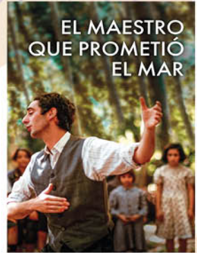
EL MAESTRO QUE PROMETIÓ EL MAR 29 Octubre

FILMOTECA REGIONAL EN LAREDO. Desde el 29 de octubre , todos los martes cine en V.O.S. Horarios: 18:00 y 20:30 h