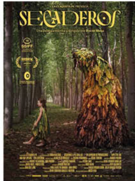
SECADEROS 12 Noviembre