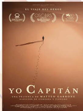
YO, CAPITÁN 10 Diciembre