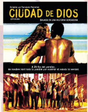
CIUDAD DE DIOS 17 Diciembre