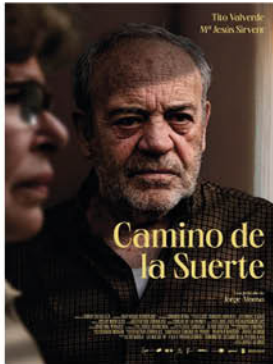
CAMINO DE LA SUERTE 5 Noviembre