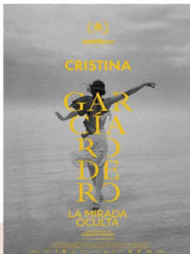
CRISTINA GARCÍA RODERO: LA MIRADA OCULTA 26 Noviembre