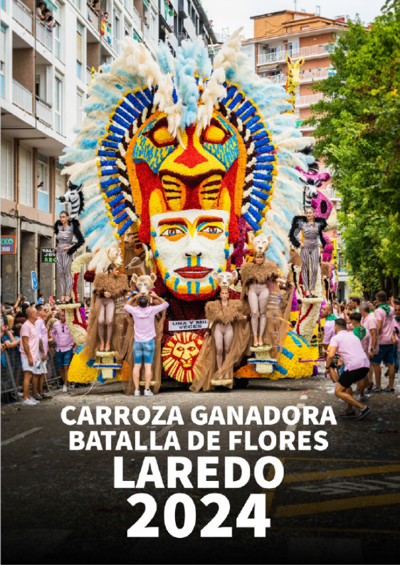
CARROZA GANADORA BATALLA DE FLORES LAREDO 2024